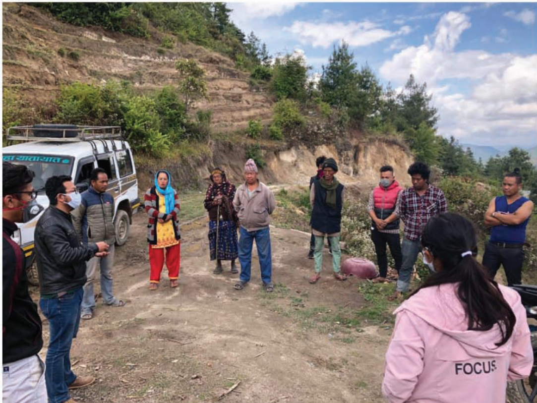
थाहानगरमा संचालन भैरकेको व्यापिट टेष्ट ।