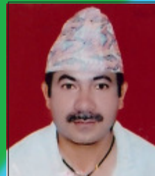
सुदर्शन पहेली खरिदार