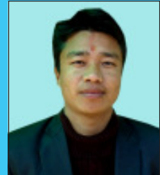
पाल्साइ लामा खरिदार