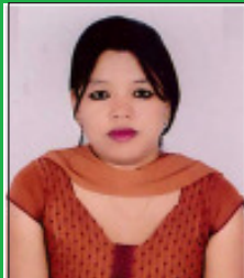
डोल्मा लामा खरिदार